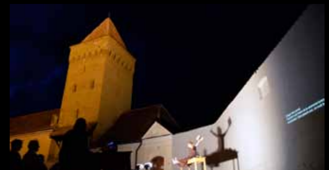
„Hexen, Heiden, Heilige“ Freilichtvorstellung in Medias / Rumänien

Eine Lichtanlage kann vom theater am barg gestellt werden.