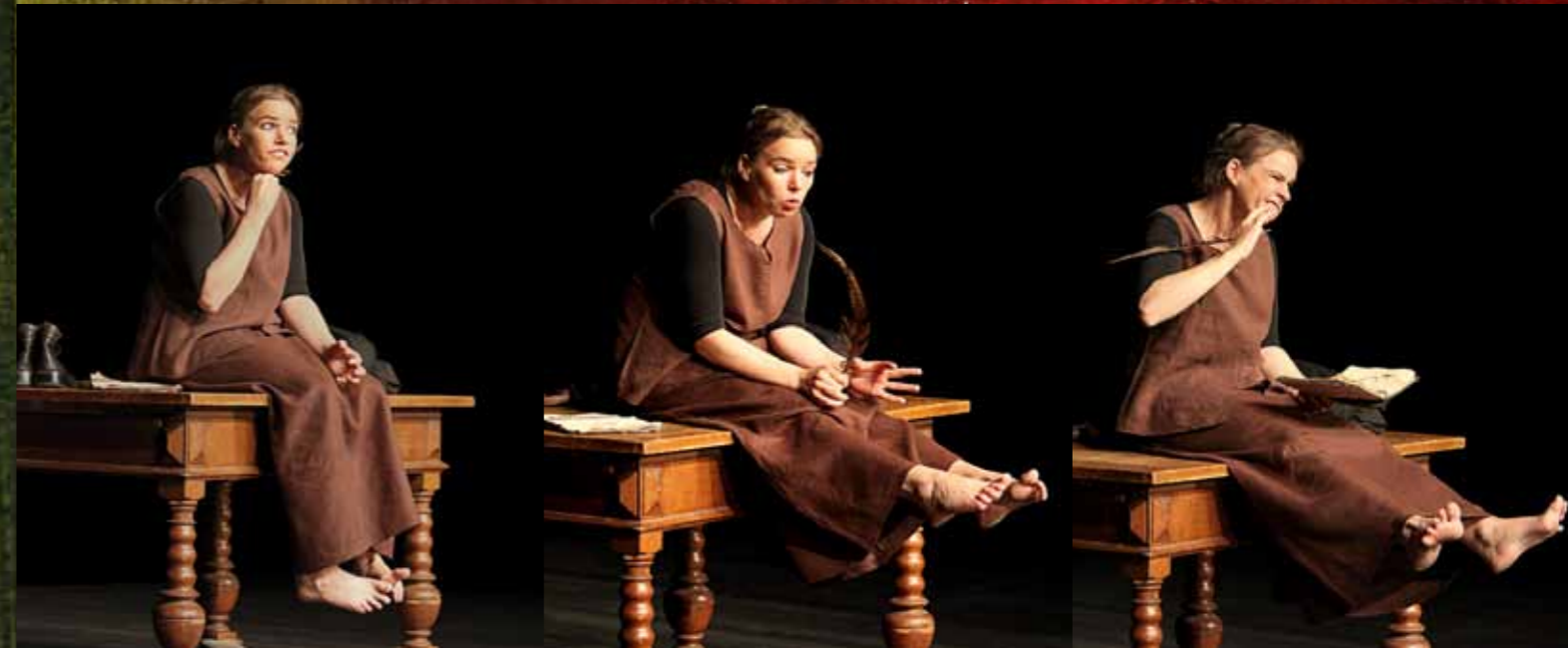
Ein Klassiker für Kurzauftritte: „Die Ratte von Hameln“

„Exzellente Leistung einer Aktrice, die mit einer enormen Wandlungsfähigkeit von einer Rolle in die nächste schlüpft.“ WOLFSBURGER ALLGEMEINE ZEITUNG